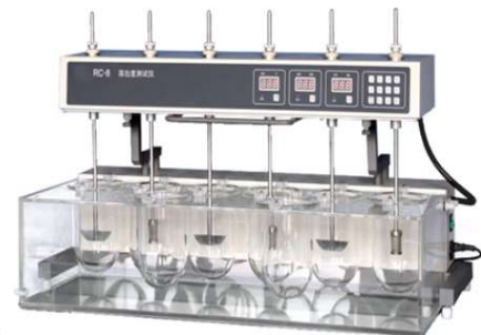
MHRC-6 Dissolution tester