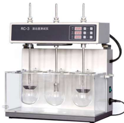
MHRC-3 Dissolution tester