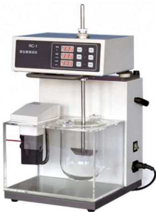
MHRC-1 Dissolution tester