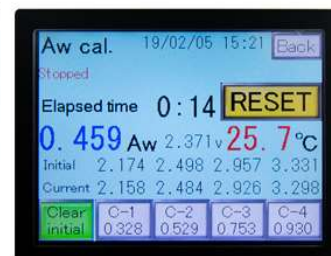
สอบเทียบค่า Aw