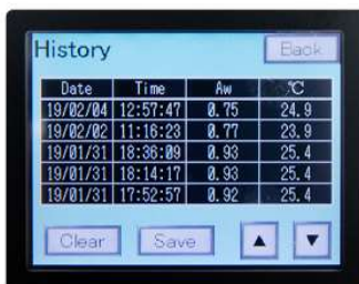
บันทึกข้อมูลภายในเครื่อง